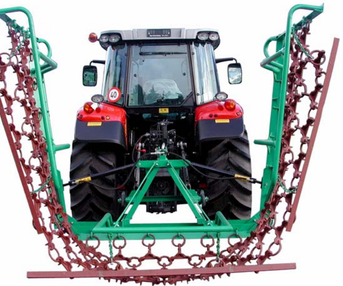
4, 5, 6 Meter hydraulisch zusammengeklappt

Anbausatz mechanische Verriegelung der Wiesenegge, bei hydraulischer Aushebung inbegriffen.